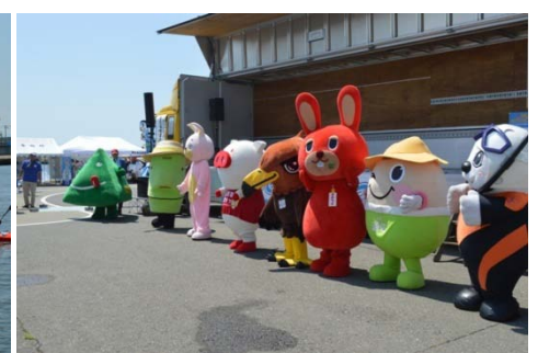
今回参加してくれた8体のゆるキャラが勢揃い