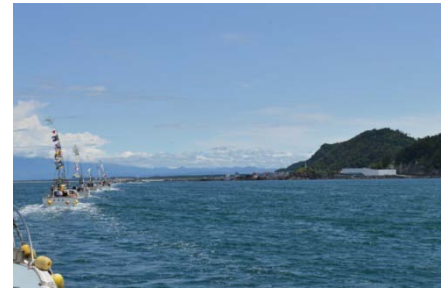
パレード中の船団とリニューアルオープンした加茂水族館

地元漁船による祝旗洋上パレードや水産高校実習船「鳥海丸」の一般公開、海産物の販売等が行われ、「みずほ」はパレードへの参加と乗船体験を行いました。