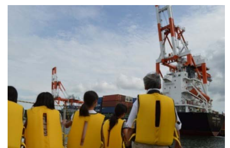
海上から国際ターミナルを見学

その後、当事務所の港湾業務艇「みずほ」に乗船し、最上川河口に位置する酒田港を見学。近年、コンテナ貨物量が増加傾向にある国際ターミナル等の説明を聞きながら酒田港の機能や果たしている役割を学習しました。