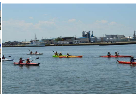
ゴール目のシーカヤック