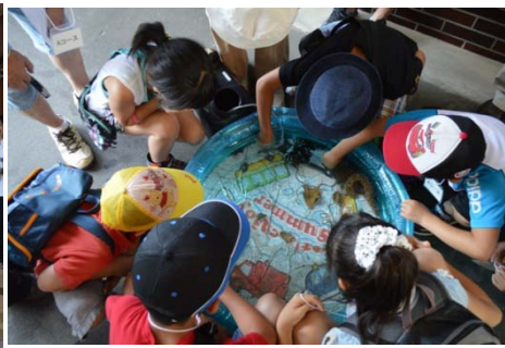
生き物は子どもに大人気！