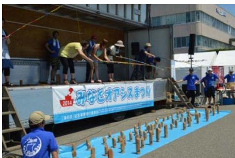
さかな型丸太釣り競争