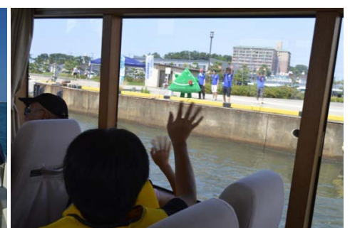
山形県のゆるキャラ「ペロリン」が見送ってくれました!