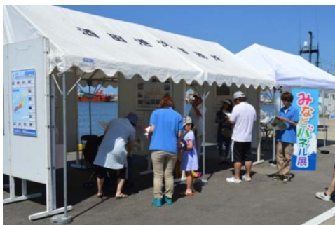
酒田港をパネルでPR