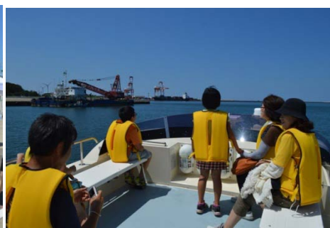
北港地区をデッキから見学