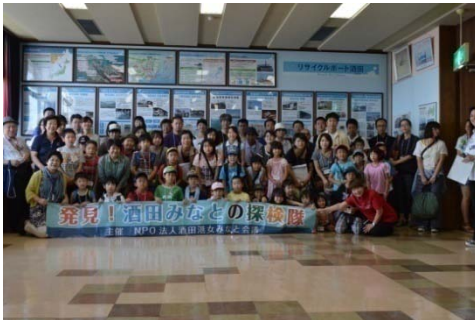
参加者みなさんで記念撮影

夕方からの港内見学は、定期旅客船「とびしま」に乗船。酒田港の機能等の説明を聞きながら港内を巡って、地域の港と海への理解を深めました。