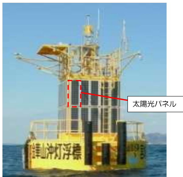
宮城中部沖GPS波浪計