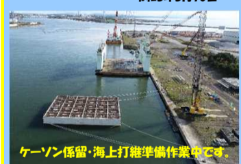
ケーソン係留・海上打撃準備作業中です。

工事名：秋田港外港地区防波堤 (第二南)本体工事 施工業者：あおみ建設株式会社 工事内容：防波堤の製作工事を行っています。 進捗状況：68.0% 工事期間：令和2年6月11日 ~ 令和3年3月10日