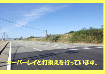
カーブレイと打換えを行っています。

工事名：統合補助改修工事 02-PC11-10 施工業者：株式会社 寒風 工事内容：舗装の補修工事を行っています。 進捗状況：5.0% 工事期間：令和2年9月18日 ~ 令和2年12月3日