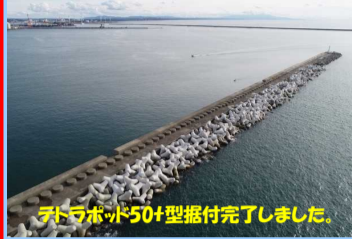
テトラポッド50t型据付完了しました。

工事名：秋田港飯島地区防波堤(北)(改良) 消波工事(その2) 施工業者：株式会社 沢木組 工事内容：消波ブロックの製作及び据付を行っています。 進捗状況：97.8% 工事期間：令和2年5月25日 ~ 令和2年11月30日