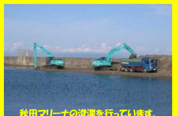
秋田マリーナの浚渫を行っています。

工事名：県単港湾整備工事 02-0251-10 施工業者：株式会社 加藤建設 工事内容：秋田港管内の浚渫を行っています。 進捗状況：30.0% 工事期間：令和2年8月7日 ~ 令和3年3月22日