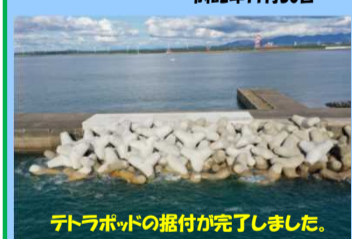
テトラポッドの据付が完了しました。

工事名：秋田港外港地区防波堤(南)(改良) 築造工事 施工業者：株式会社 沢木組 工事内容：防波堤の築造工事を行っています。 進捗状況：99.5% 工事期間：令和2年4月13日 ~ 令和2年11月30日