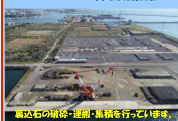
基礎石の砕破・運搬・集積を行っています。

工事名：秋田港飯島地区岸壁(-11m)(改良) (耐震)地盤改良工事(その2) 施工業者：若築・あおみJV 工事内容：基礎石の崩壊と底上土の中間処理を行っています。 進捗状況：91.0% 工事期間：令和元年12月5日 ~ 令和2年12月18日